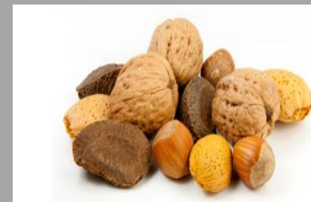
7 – Fruits à coques