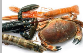
2 - Crustacés