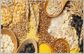
1 – Céréales (gluten)