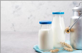
6 – Produits laitiers