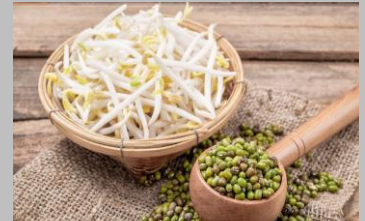
5 - Soja