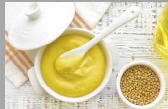
9 – Moutarde