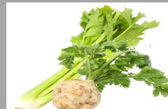
8 – Céleris