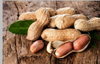
3 – Arachides