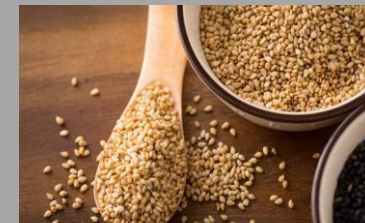
10 – Sésame