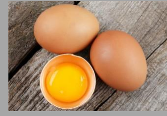
14 – Œufs