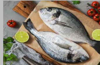
4 - Poissons