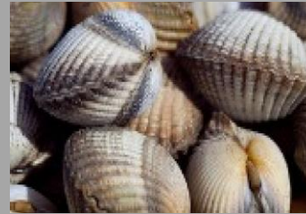
13 – Mollusques