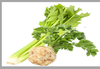
8 – Céleri