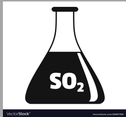
11 – Anhydride sulfureux/sulfites