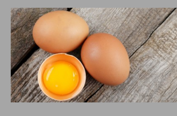
14 – Œufs