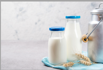
6 – Produits laitiers