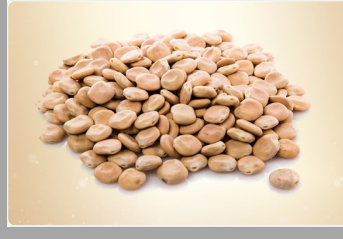
12 – Lupin