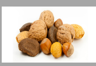
7 – Fruits à coques