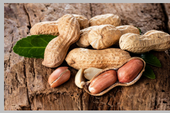
3 – Arachides