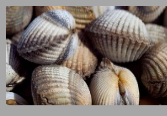
13 – Mollusques