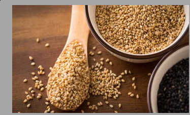
10 – Sésame