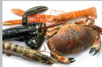
2 - Crustacés