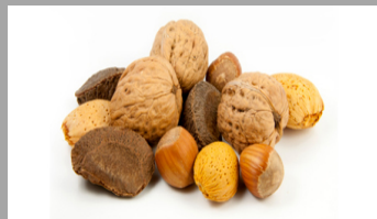
7 – Fruits à coques