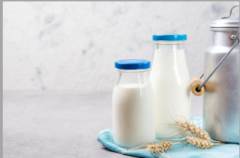
6 – Produits laitiers