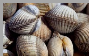
13 – Mollusques