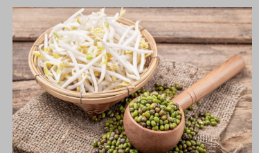
5 - Soja