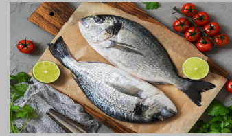
4 - Poissons