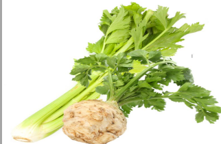
8 – Céleris