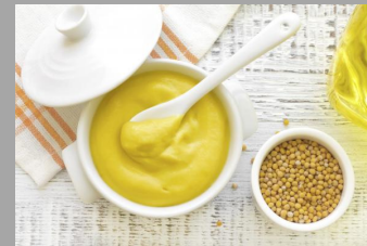
9 – Moutarde