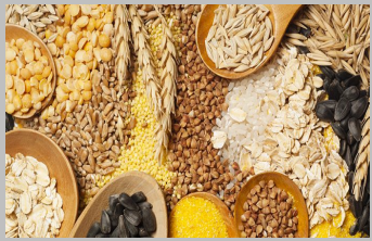
1 – Céréales (gluten)