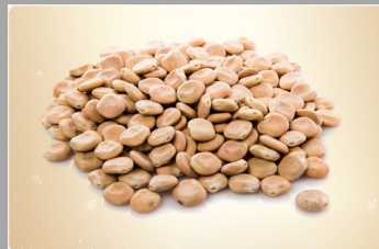
12 – Lupin