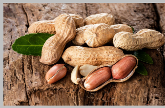
3 – Arachides