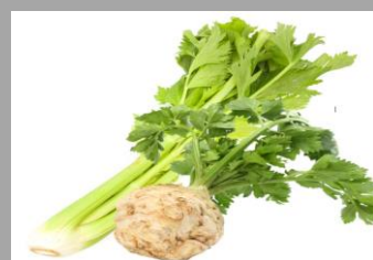
8 – Céleris