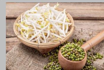
5 - Soja