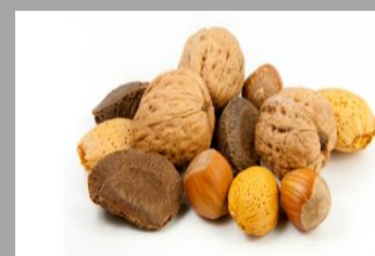
7 – Fruits à coques