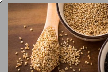
10 – Sésame