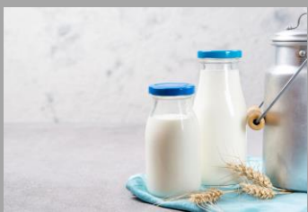
6 – Produits laitiers