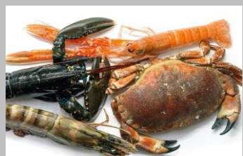
2 - Crustacés