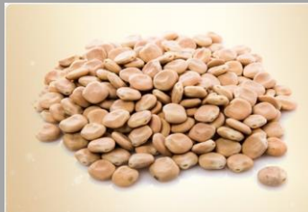
12 – Lupin