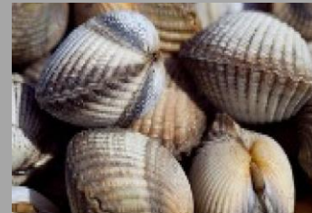
13 – Mollusques