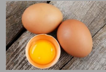
14 – Œufs