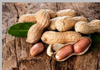
3 – Arachides