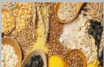
1 – Céréales (gluten)

Chaque numéro correspond à un allergène : voir liste au verso - Les repas livrés chauds sont à consommer le jour même - Les repas des samedis et dimanches, livrés froids le vendredi, sont à conserver à une température comprise entre 0°et 3°et à consommer dans les 48 heures à compter du jour de livraison. Menus réalisés sous réserve de toute modification.