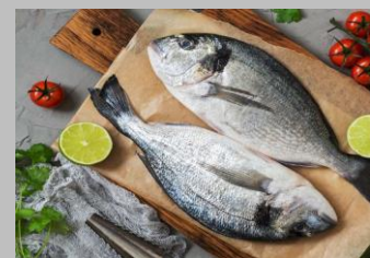
4 - Poissons